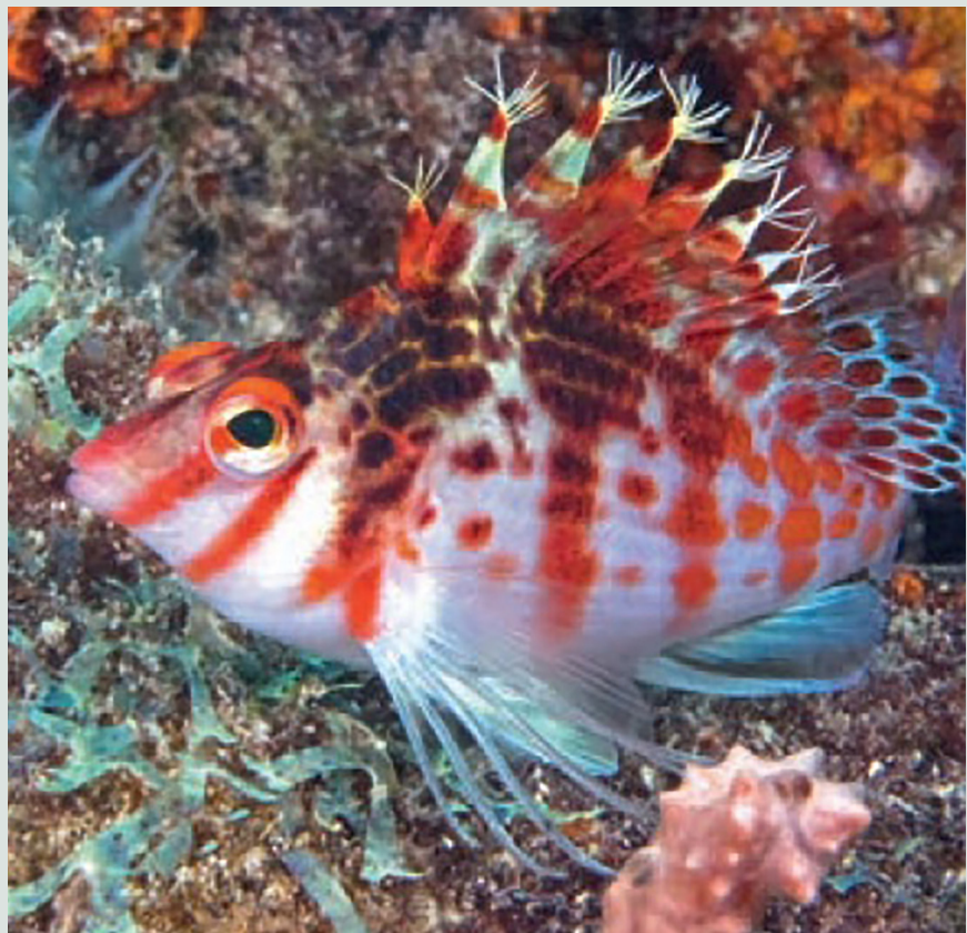
Dwerg koraalklimmer ( Cirrhitichthys falco ). De borsteltjes aan het uiteinde van de rugvinstralen zijn goed zichtbaar.

Koraalklimmers ondergaan gedurende hun leven een geslachtsverandering. Ze worden als vrouwtjes geboren en veranderen als de noodzaak zich voordoet in mannetjes (dat heet 'protogyne geslachtsverandering'). Evenals bij de vlaggenbaarsjes heeft een mannetje een aantal harem-vrouwtjes waarover hij waakt. Tijdens de paaitijd – meestal tijdens het invallen van de duisternis of gedurende de nacht – zwemmen de vissen paarsgewijs naar de waterspiegel. Nadat beide dieren hun voortplantingscellen hebben uitgestoten, vindt daar de bevruchting plaats. De cellen worden door de stroming meegevoerd en over een enorm gebied verspreid.