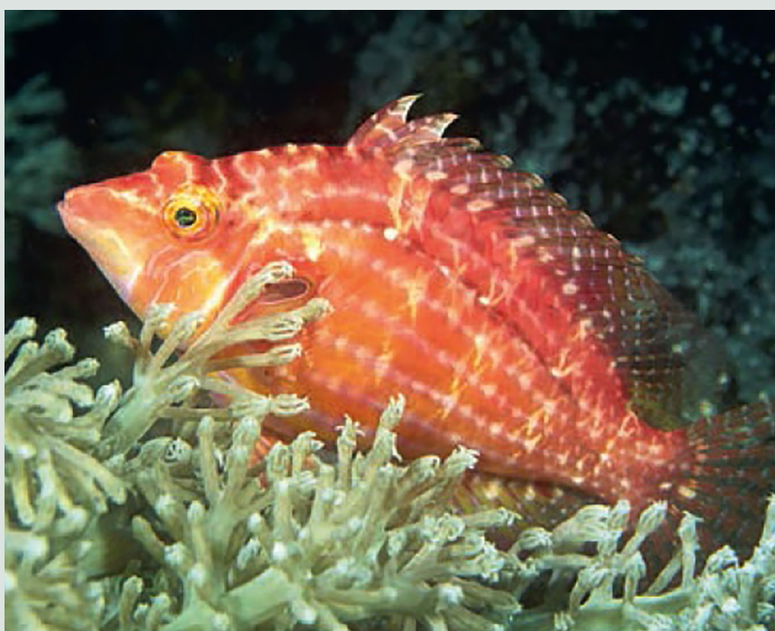
Gouden koraalklimmer Cirrhitichthys aureus