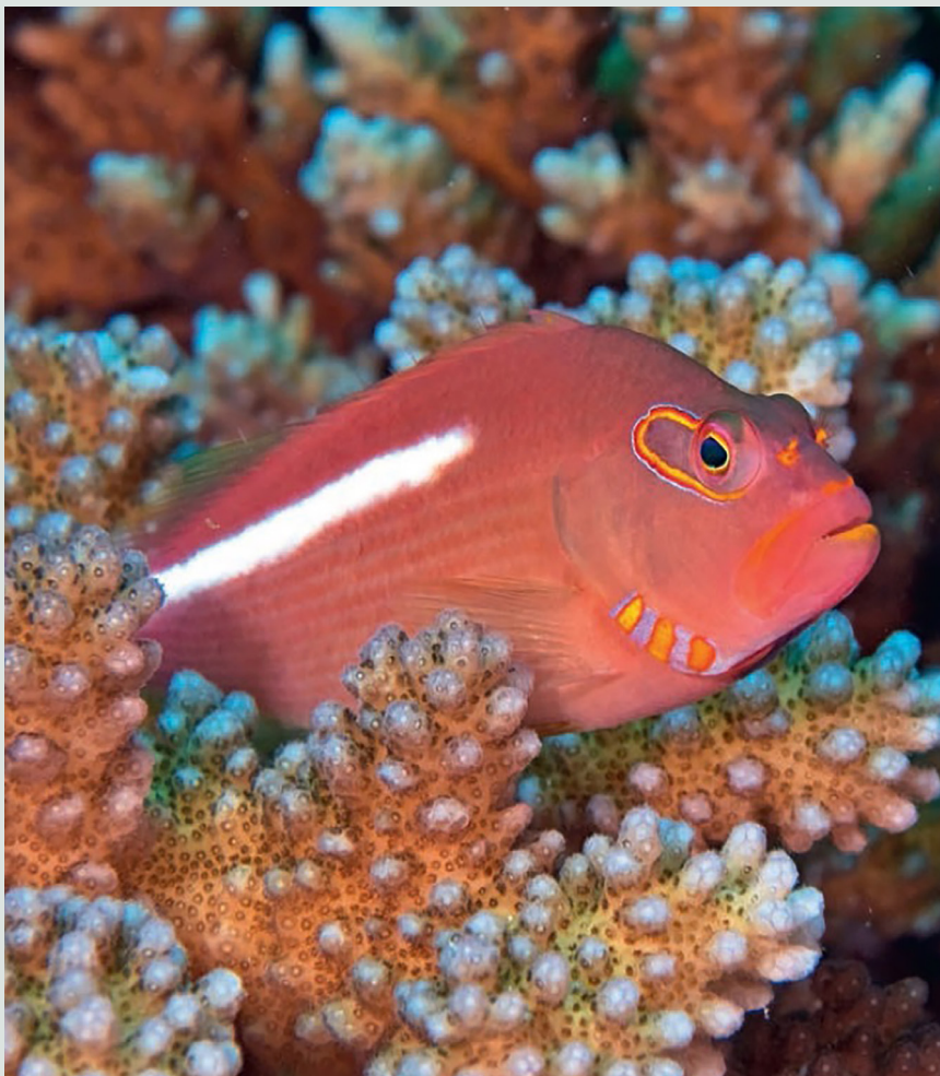
Rode koraalklimmer Paracirrhites arcatus

Dit dier wordt maximaal tien centimeter. Zijn lichaam is bedekt met mooie oranjerode vlekken. Deze soort komt voor tot een diepte van 40 meter. Maar er zijn ook grotere soorten zoals de halfgevekte koraalklimmer, die 29 centimeter wordt en bijna uitsluitend bij oceaaneilanden voorkomt. Naast zijn rode kop en donkere vlekken is een witte lengtestreep typerend voor deze soort, met als variant een kleine, witte vlek. Met zijn 28 centimeter behoort de reuzen koraalklimmer ( Cirrhitichthys pinulatus ) tot de grote soorten. Hij leeft in zeer ondiep water (0,3-3 meter), dus in de brandingszone, vooral op stenen. Zijn donkere lichaam is bedekt met helderwitte vlekken.